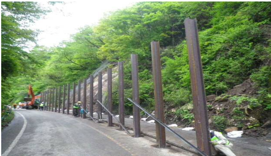
▲ 仮防護柵の設置状況①

・H28. 05. 01: 県道11号別府一の宮線にて、仮防護柵を設置しました。