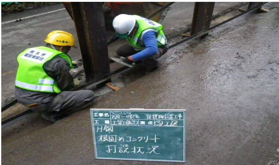
▲ 根固めコンクリート打設状況①