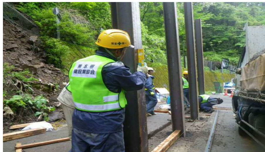
▲ 仮防護柵の設置状況②